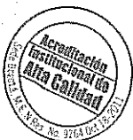
HÉCTOR FABIO JARAMILLO SANTAMARÍA

Sede Principal: Cra. 9 No. 51-11, PBX: 57(1) 587 8797 - Sede de Lourdes: Cra. 9 No. 63-28, PBX: 57(1) 595 0000